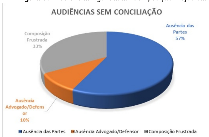
Figura 06: Audiências Agendadas. Composição Prejudicada