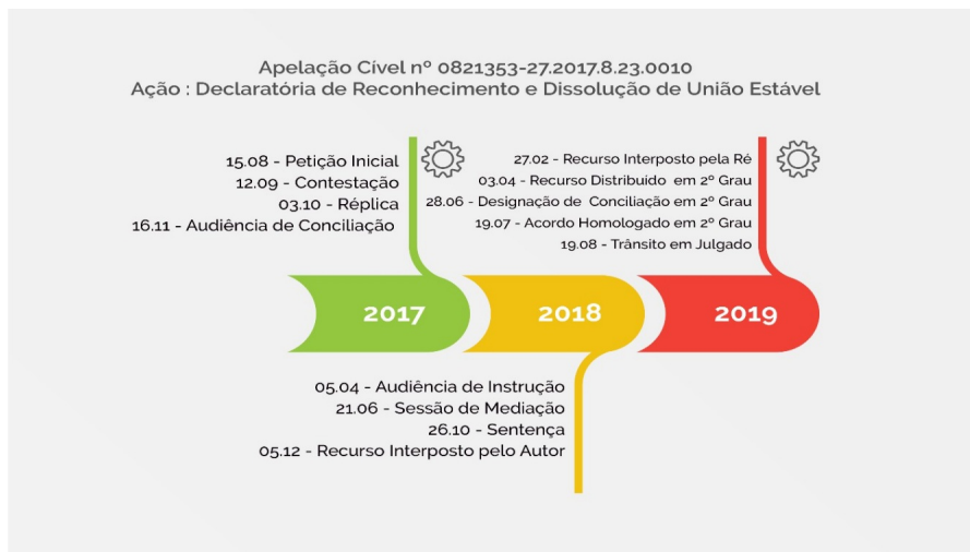
Figura 04: Apelação Cível nº 0821353-27.2017.8.23.0010

Fonte: Elaborado a partir dos Sistemas do Tribunal de Justiça (2020).