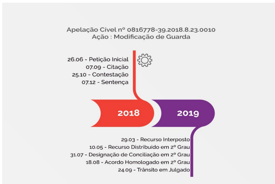
Figura 03: Apelação Cível nº 0816778-39.2018.8.23.0010

Fonte: Elaborado a partir dos Sistemas do Tribunal e Justiça (2020).