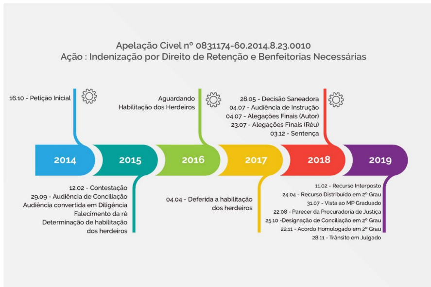
Figura 01: Apelação Cível nº 0831174-60.2014.8.23.0010

Fonte: Elaborado a partir dos Sistemas do Tribunal de Justiça (2020).