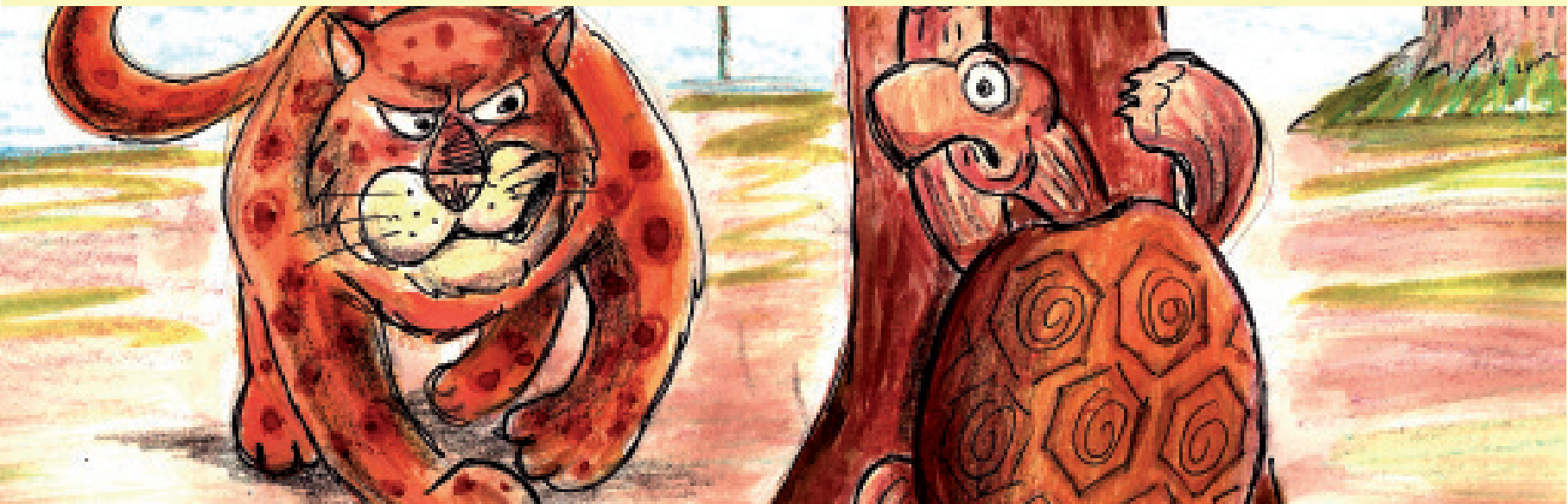
Ilustração Marco Aurélio Rodrigues